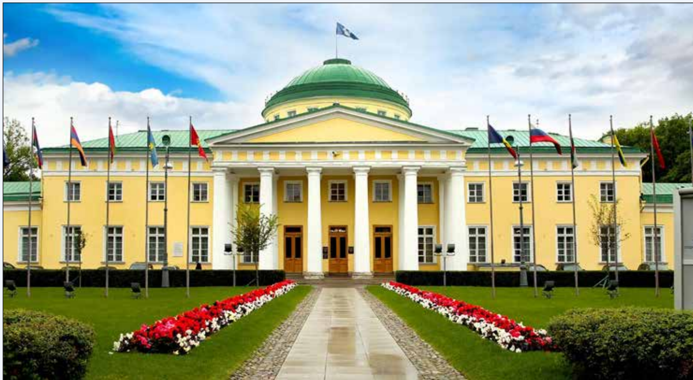
Здание Межпарламентской Ассамблеи государств — участников СНГ в г. Санкт-Петербурге

совет по проблемам санитарной охраны территорий государств — участников СНГ от завоза и распространения особо опасных инфекционных болезней, созданный Советом по сотрудничеству в области здравоохранения СНГ в 2000 году. Благодаря ему на постоянной основе был налажен обмен оперативной информацией о состоянии заболеваемости населения, используемых лекарственных средствах и средствах профилактики.