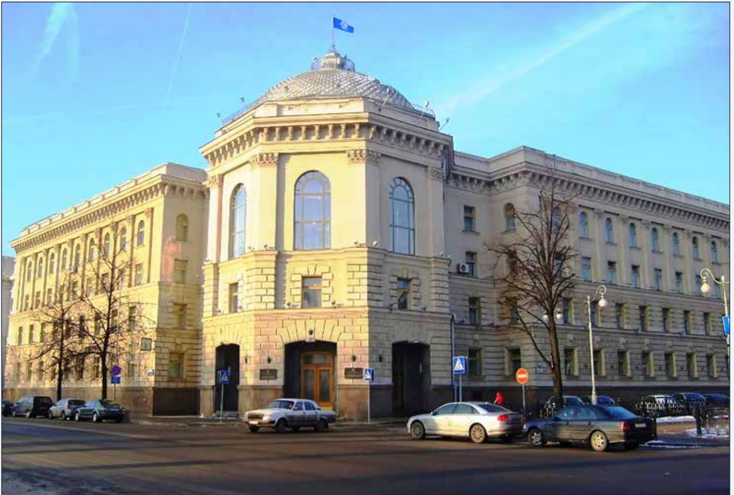
Здание Исполнительного комитета СНГ в г. Минске

15. Повышение эффективности использования транзитно-транспортного потенциала государств — участников СНГ, согласованное развитие трансграничных транспортных коридоров и их интеграция в международные транспортно-логистические цепочки.